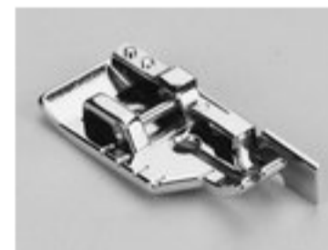
BERNINA STOPKA DO QUILTINGU