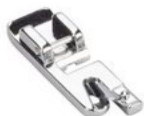
BERNINA STOPKA DO PODWIJANIA 5 MM