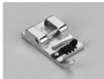
BERNINA STOPKA DO KORDONKÓW 5 OTWORÓW