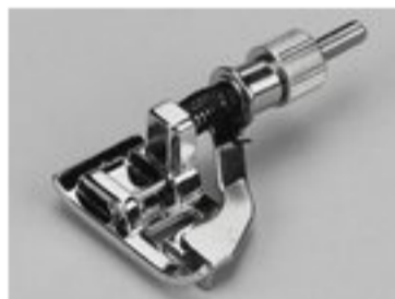
BERNINA STOPKA DO ŚCIEGU KRYTEGO 5 MM