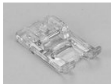
BERNINA STOPKA DO APLIKACJI 7 MM