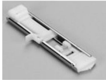
BERNINA AUTOMAT DO DZIUREK