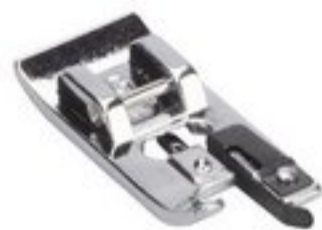
BERNINA STOPKA OWERLOKOWA 5 MM