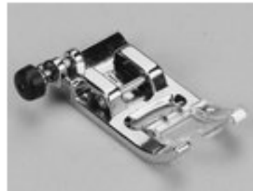
BERNINA STOPKA STANDARDOWA 7 MM