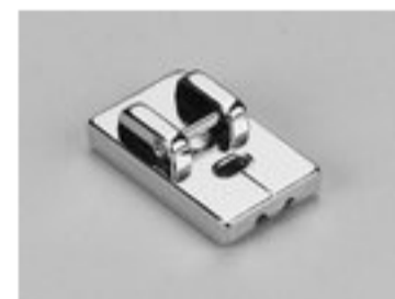
BERNINA STOPKA DO ZAMKÓW KRYTYCH