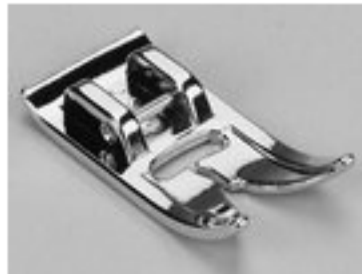
BERNINA STOPKA STANDARDOWA 5 MM