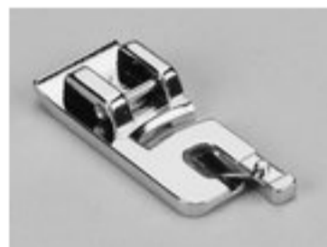
BERNINA STOPKA DO PODWIJANIA 7 MM