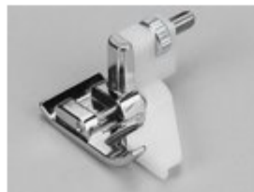
BERNINA STOPKA DO ŚCIEGU KRYTEGO 7 MM