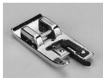
BERNINA STOPKA OWERLOKOWA 7 MM