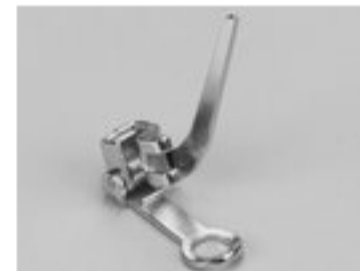
BERNINA STOPKA DO HAFTOWANIA