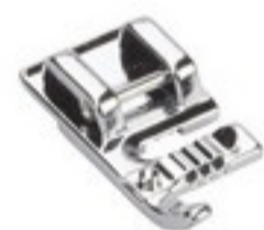
BERNINA STOPKA DO KORDONKÓW 3 OTWORY