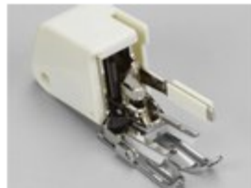
BERNINA STOPKA Z GÓRNYM TRANSPORTEM 7 MM