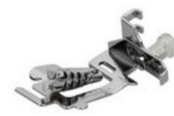
BERNINA STOPKA DO LAMOWANIA