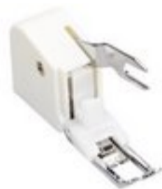
BERNINA STOPKA Z GÓRNYM TRANSPORTEM 5 MM