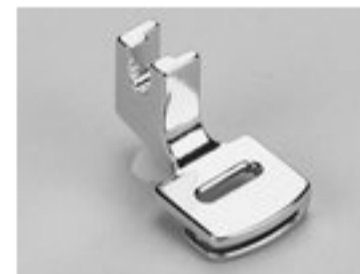
BERNINA STOPKA DO MARSZCZENIA