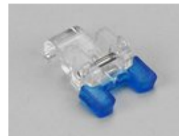
BERNINA STOPKA DO PRZYSZYWANIA GUZIKÓW