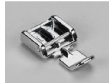
BERNINA STOPKA DO ZAMKÓW BŁYSKAWICZNYCH