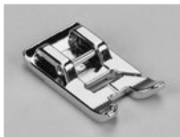
BERNINA STOPKA DO APLIKACJI 5 MM